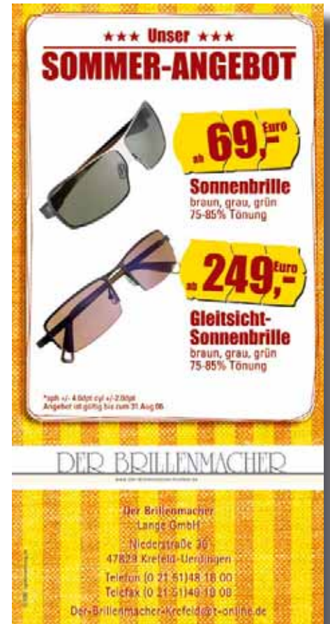
Flyer: Vorderseite mit und ohne Capri-Sonnen-Tüte,